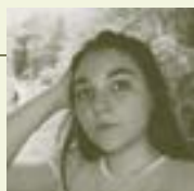
JASMYNE BASILE HÉBERT

Véronique Basile Hébert est une femme de théâtre atikamekw de la communauté de Wemotaci. Doctorante en études et pratiques des arts à l'UQAM, elle détient un baccalauréat en théâtre de l'Université d'Ottawa ainsi qu'une maîtrise en dramaturgie. Participante du programme de théâtre autochtone de l'École nationale de théâtre du Canada, Véronique a également été élève et assistante de la compagnie de théâtre L'École sauvage. Elle a été l'une des créatrices du théâtre de rue du Festival Présence autochtone de Montréal. Elle produit des œuvres dans les communautés autochtones et a collaboré aussi avec diverses compagnies de théâtre. Son théâtre est engagé, près de ses préoccupations d'autochtone, de femme et d'artiste.